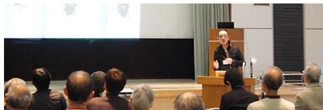
第24回市民環境活動報告会の発表会場